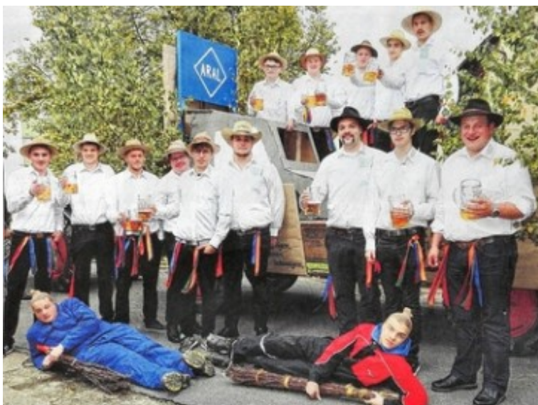
Kerwaburschen und Kerwasäue beim Umzug

Auf die Kerwazeitung wartet Jung und Alt beim Umzug, welche Gegebenheiten werden darin erwähnt was ist zum Schmunzeln was zum Diskutieren. Aber immer unterhaltsam in "Welbhäuser Mundart Fränkisch" die Welblech-City -Times der Kerwaburschen.